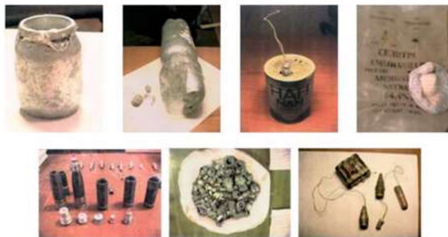
Фотографии взрывных устройств и их компонентов, изготовленных из штатных боеприпасов, аммиачной селитры и алюминиевой пудры, изъятых в процессе оперативно-розыскных мероприятий оперработниками ФСБ России

ПОМНИТЕ: внешний вид предмета может скрывать его настоящее назначение. В качестве камуфляжа для взрывных устройств используются обычные бытовые предметы: сумки, пакеты, свертки, коробки, игрушки и т.п.